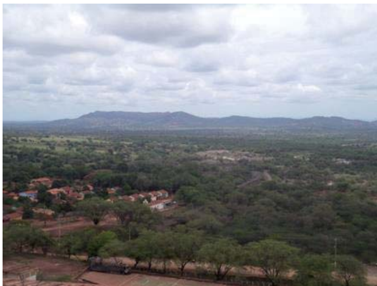
Figura 3 – Vista panorâmica da pilha de rejeitos e bairro urbano