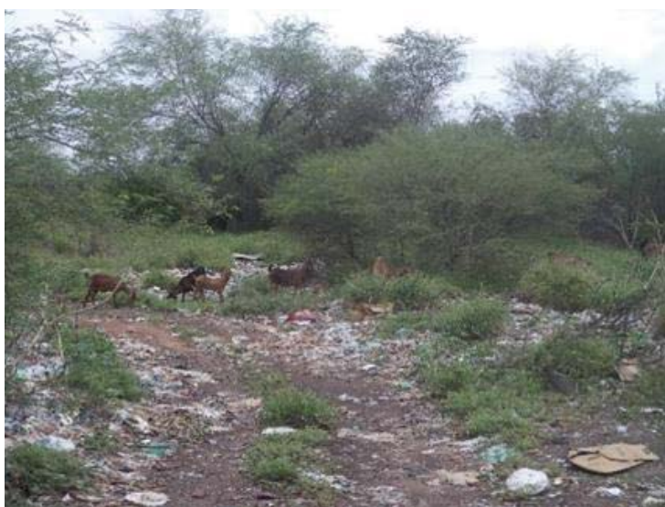
Figura 5 – Animais pastejando em meio ao lixão instalado sobre a pilha de rejeitos