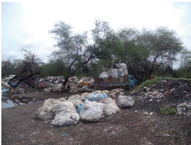
Figura 4 – Coleta de materiais recicláveis no lixão instalado sobre a pilha de rejeitos