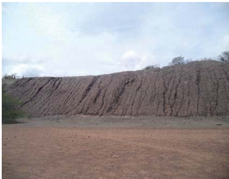
Figura 2 – Pilha de rejeitos com diversos canais de erosão

Apesar de os estudos científicos sobre a toxicologia do Pb serem desenvolvidos há mais de um século, ainda são insuficientes as informações sobre os mecanismos de ação que originam os efeitos tóxicos desse metal. Os resultados da exposição ao Pb sobre a saúde humana devem ser estudados com maior profundidade. Nesse contexto, é de fundamental importância investigar os efeitos do Pb nos sistemas nervoso, endócrino e cardiovascular; nos ossos, fígado e rins; sobre a reprodução masculina, feminina e na formação dos fetos. Também é essencial esclarecer a possibilidade do Pb ter efeitos carcinogênicos e levar a disfunções psicológicas e neurocomportamentais (MOREIRA; MOREIRA, 2004).